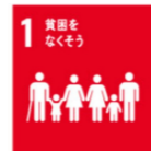
「フードバンクふじのくに」への寄贈式(11/4)