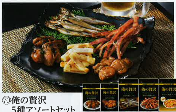
⑦0 俺の贅沢 5種アソートセット