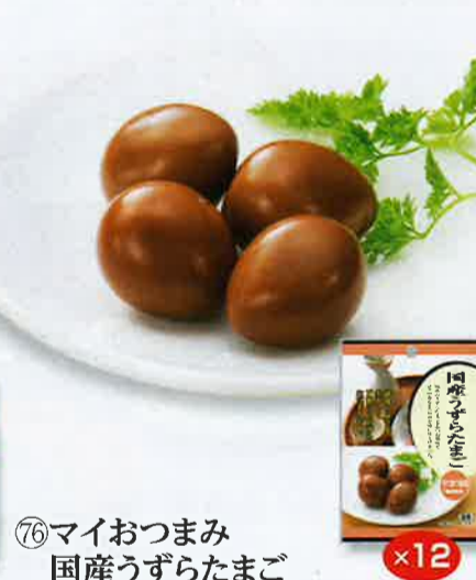
⑦6 マイおつまみ 国産うずらたまご