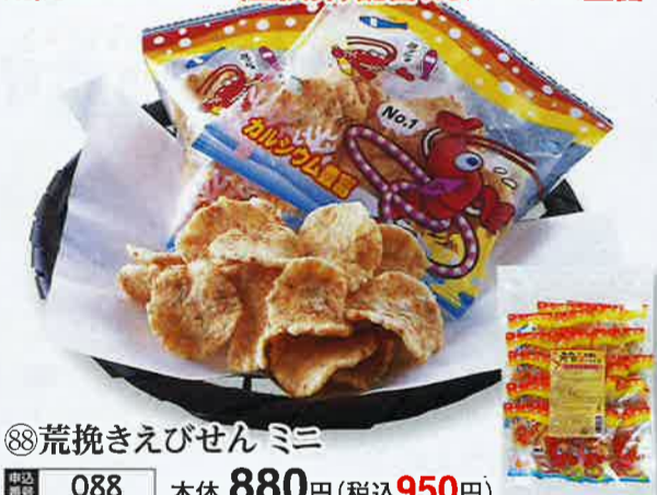
⑧8荒挽きえびせん ミニ