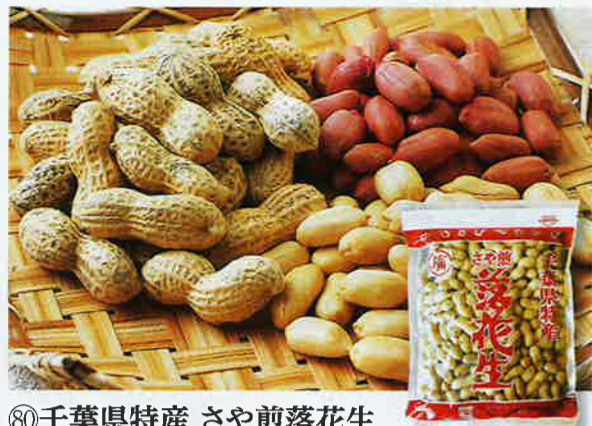
⑧〇千葉県特産 さや煎落花生