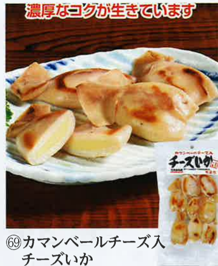
⑥9 カマンベールチーズ入 チーズいか