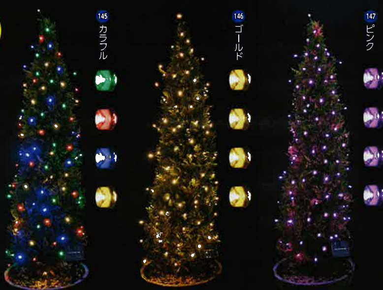
お庭や玄関・テラスなどのデコレーションに。防犯対策にも。

※(145-146-147)共通 ★内容:本体(ソーラーパネル部・コード・LED100球)、支柱、固定くさび★サイズ:本体=約6.7×6.7×24cm(ソーラーパネル部・支柱組立時)、コード長=約12m★重量:約200g(コード・支柱・固定くさびを含む)★フル充電時間(目安):約8~10時間★点灯時間(目安):連続点灯時=約6~8時間、点滅時=約7~9時間★材質:ABS樹脂、LED、ポリプロピレン、スチール★生産国:中国 ※最初にご使用の際は、日当たりのよい場所で十分に充電してください。 ※生活防水程度の機能で、大雨・暴風などの悪天候の場合は破損することがあります。 ※フル充電時間や点灯時間の目安は、設置場所・天候・季節により多少差異があります。