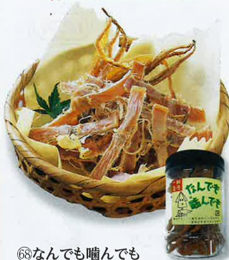
⑥8 なんでも噛んでも