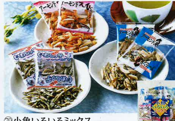
⑦9 小魚いろいろミックス