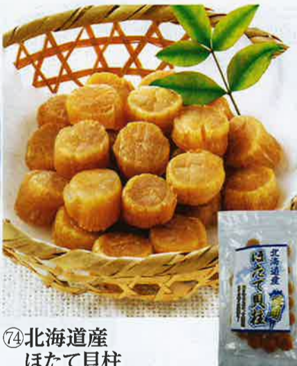
⑦4 北海道産 ほたて貝柱