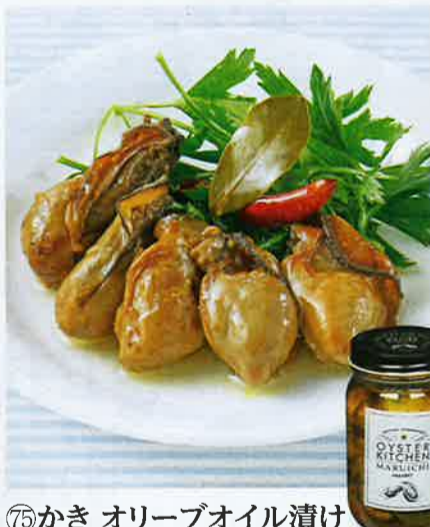
⑦5 かき オリーブオイル漬け