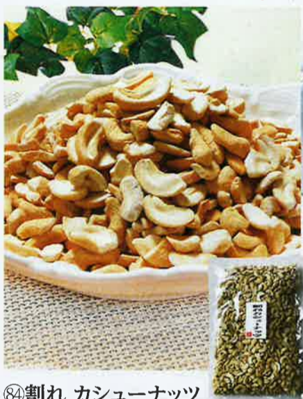
⑧4割れ カシューナッツ