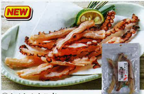
⑦1 カメカメ たこ吉