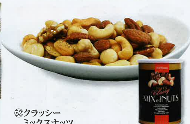
⑧2クラッシー ミックスナッツ