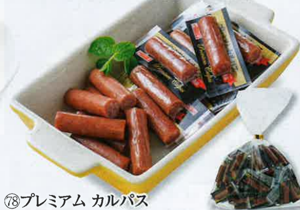
⑦8 プレミアム カルパス