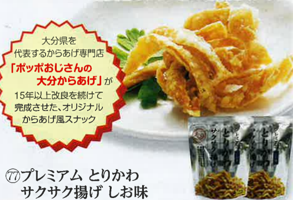
⑦7 プレミアム とりかわ サクサク揚げしお味