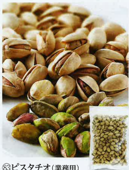
⑧3ピスタチオ(業務用)