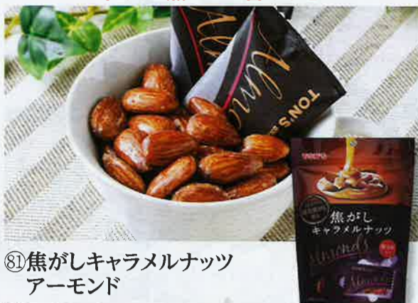
⑧1焦がしキャラメルナッツ アーモンド