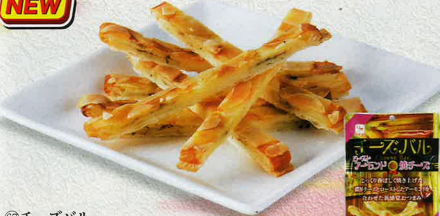
⑥7 チーズバル ローストアーモンド+焼チーズ