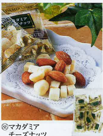
⑧6マカダミア チーズナッツ