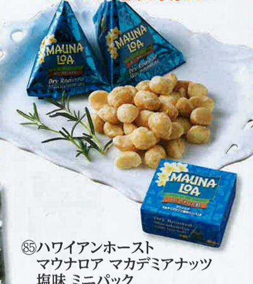
⑧5ハワイアンホースト マウナロア マカデミアナッツ 塩味 ミニパック